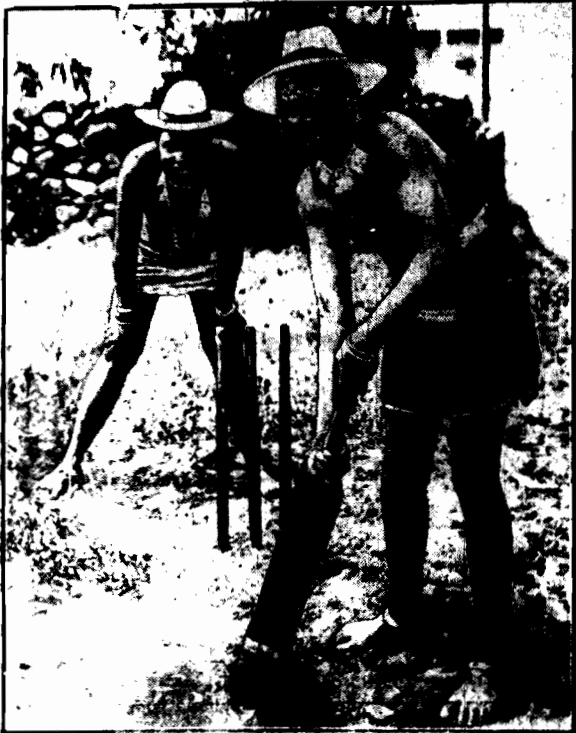
Partia krokieta w Południowej Afryce.