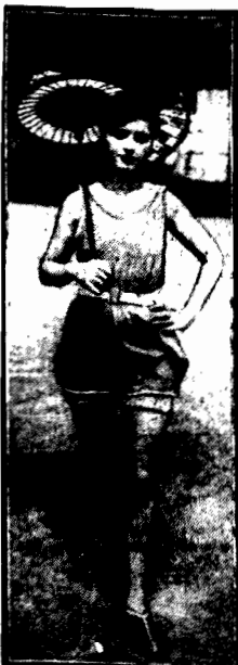
W najnowszym kostjumie kąpielowym — pod japońską parasolką.