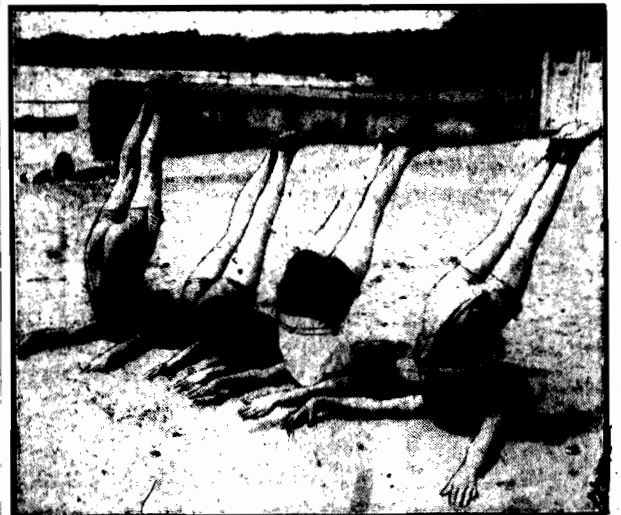
Na ustromej części plaży.