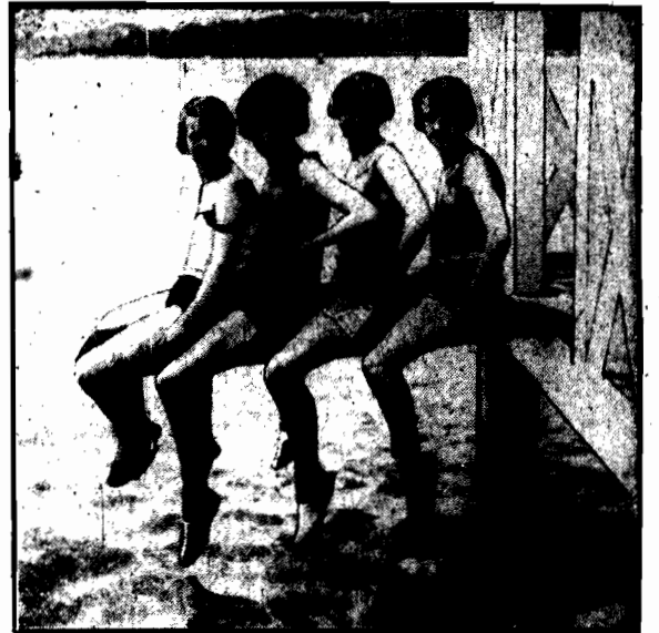
Na pływackiej trampolinie.