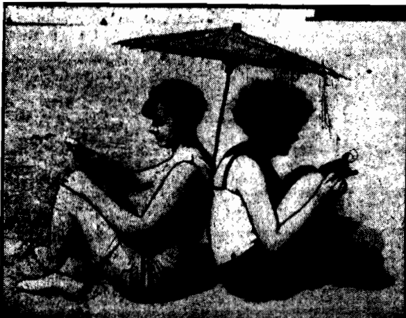
W najnowszym kostjumie kąpielowym — pod japońską parasolką.